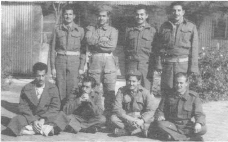
له گه‌ل ده‌سته‌یه‌ک نه‌فسه‌ر و سه‌ربازدا